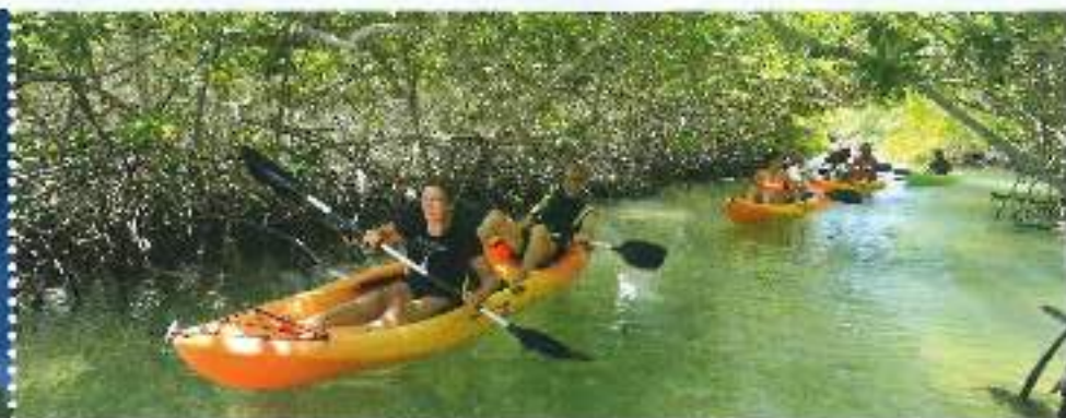
Mangroves bij Lac Bay