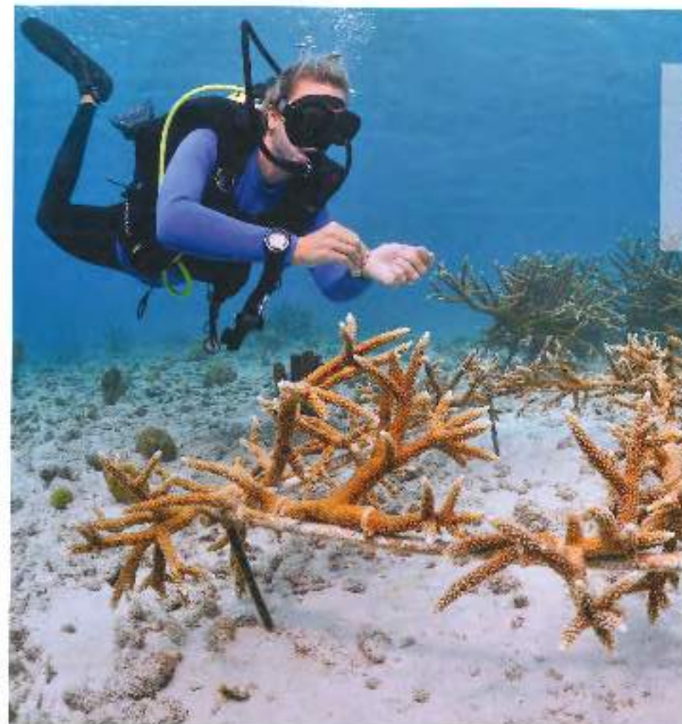
Om het rif te herstellen worden stukjes koraal doornikdoen geknipt en met rylband naar speciale rekjes gebracht.

Bonaire is zuinig op zijn natuur. Onder en boven water. 'Het gaat centimeter voor centimeter, maar we beginnen nu het effect te zien.'